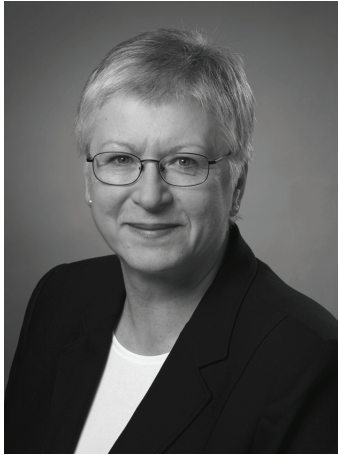
Sheila Fraser, vérificatrice générale du Canada

J'ai le plaisir de présenter le Rapport sur les plans et les priorités de mon Bureau pour l'exercice 2008-2009.