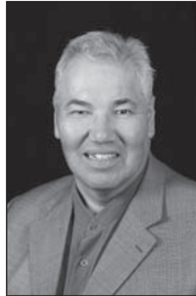
L'honorable juge Murray Sinclair

Le mandat de la Commission consiste, brièvement, à communiquer aux Canadiens l'histoire des pensionnats indiens; à permettre à tous les anciens élèves et membres du personnel, ainsi qu'à toute autre personne touchée par les pensionnats indiens, de participer à relater cette histoire par l'intermédiaire d'événements nationaux et communautaires et par la collecte de déclarations; à recueillir toutes les données pertinentes sur cette période de l'histoire et ses répercussions; à mener une recherche nouvelle fondée sur les efforts déployés jusqu'ici; à contribuer à la commémoration de ce volet de notre histoire; à établir un centre national de recherche; à rédiger des rapports sur l'histoire des pensionnats indiens. La Commission est donc appelée à jouer un rôle important dans le processus de divulgation de la vérité, ainsi que dans la guérison et la réconciliation au sein des familles autochtones, de même qu'entre les Autochtones et les collectivités, les églises, les gouvernements non autochtones et le reste de la population canadienne.